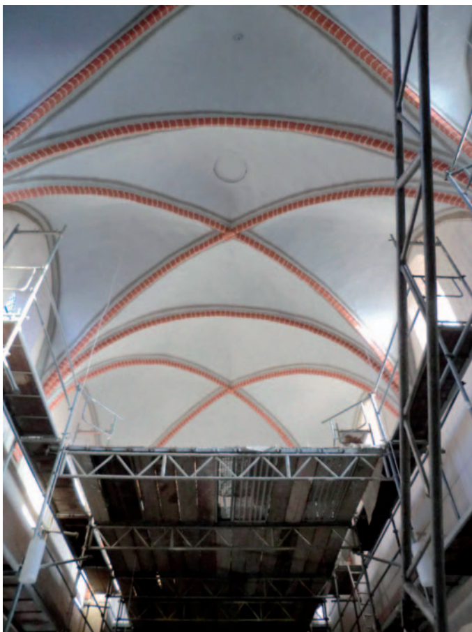
Renovierung des Innengewölbes - kurz vor der Vollendung -