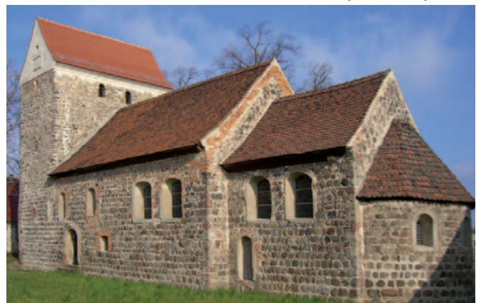
Älteste Dorfkirche Brandenburgs