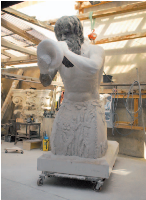
TRITON-Modell in Originalgröße