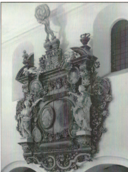
Restaurierung des Epitaphs