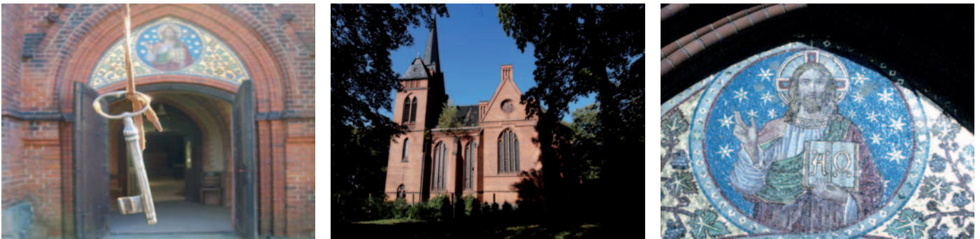
Schlüsselübergabe und Beginn der Restaurierung der Kirche