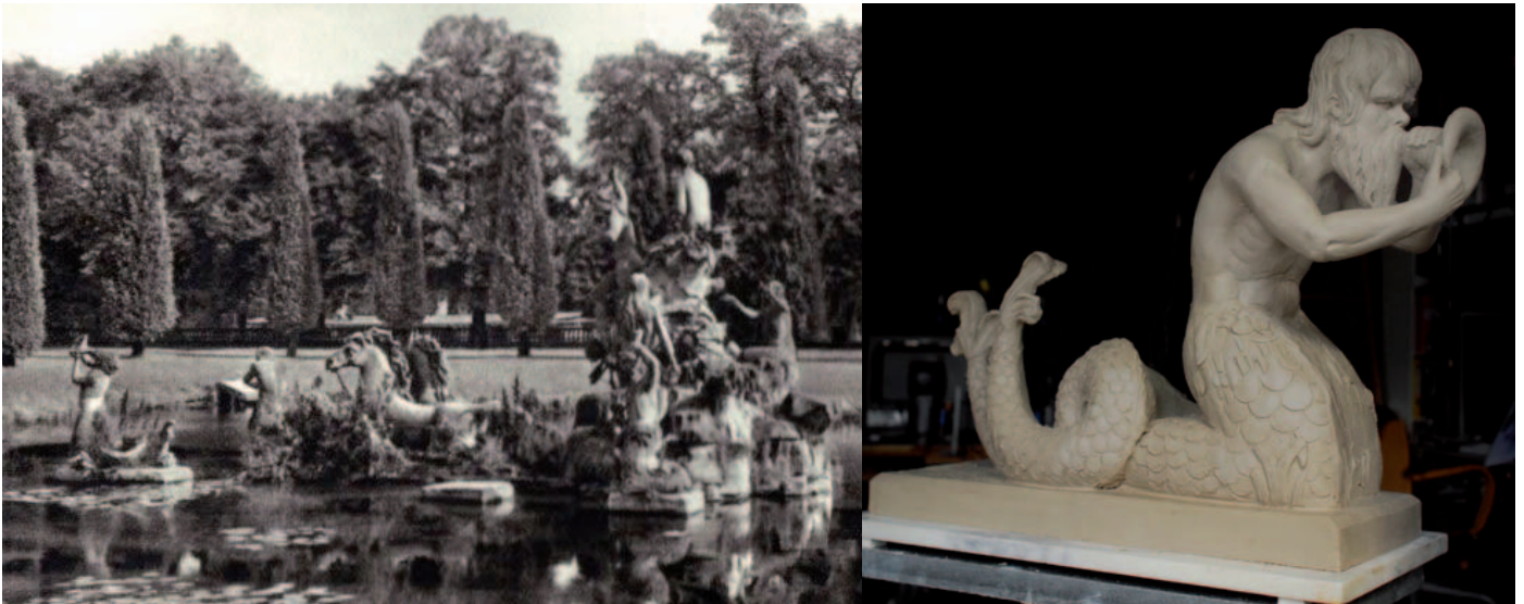
Neuanfertigung der beiden Tritonen